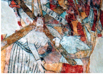
Chemin de croix

Dans le chœur, on a récemment mis à jour des fresques qui datent des XIV e et XV e siècles. Elles présentent aux fidèles des motifs relatifs au Nouveau Testament et à la vie de Saint Martin :