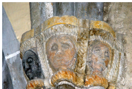
Chapiteau des femmes

L'église se compose d'une nef de trois travées flanquée de chapelles latérales avec voûtes en croisée d'ogive. L'une d'elles appartenait aux seigneurs de Greil de la Volpilère dont le château, actuellement en ruines, se trouve en face du bourg de Saint Martin sur la rive gauche du Brezons.