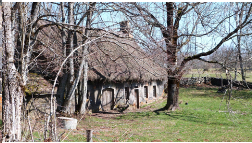
Vue de la propriété en hiver