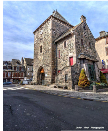
La tour de Monaco