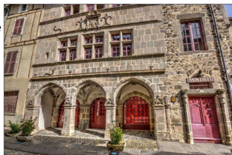
L'hotel de Cadillac

Il héberge depuis 2006 la Mairie de Mur de Barrez