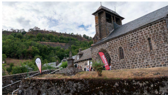
L'extérieur de l'église

La non concordance de l'axe du porche (déporté vers l'ouest) avec celui du portail indique que la construction de ce dernier est postérieure.